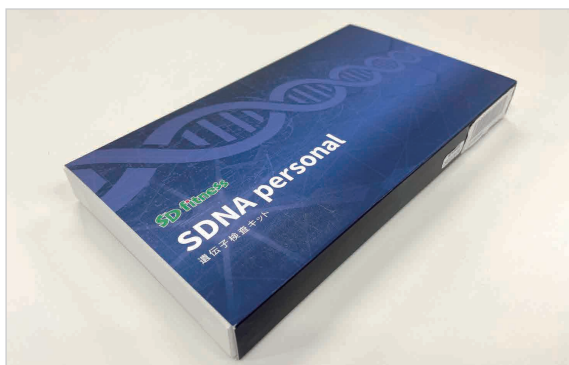
SDNA遺伝子検査キット

遺伝子検査によって利用者の体質を可視化し、体質に合った運動プランをご提供するトレーニングサービスです。専門トレーナーが、遺伝子検査の結果と利用者が求める効果を基に、個別に設計した最適な運動プランをご提供いたします。