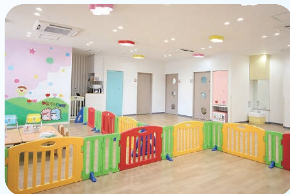
ディノスキッズ東区役所前園