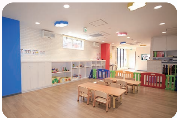
ディノスキッズ月寒中央園