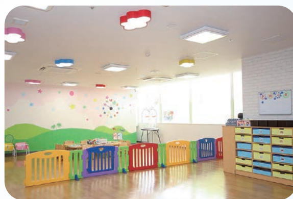
ディノスキッズ麻生園