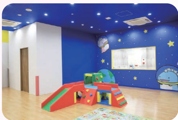
ディノスキッズ白石園